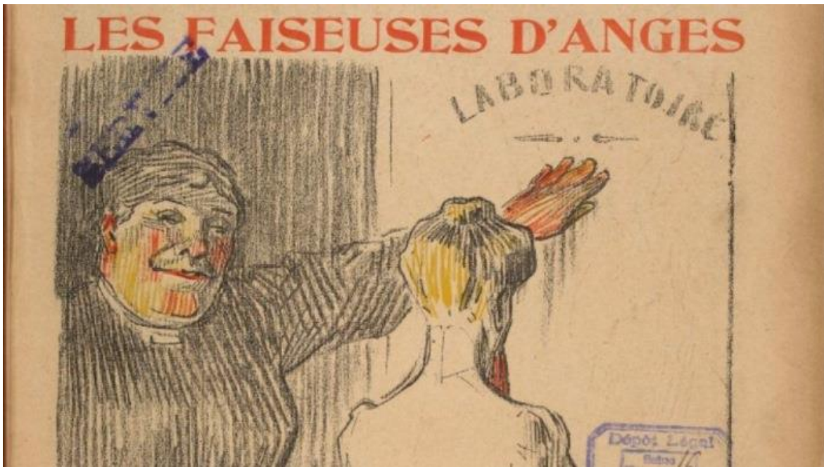
L'Assiette au beurre, 13 avril 1907